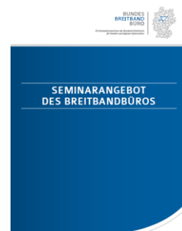
Der Seminarkatalog des Breitbandbüro des Bundes

Damit Kommunen den Breitbandausbau in ihren Regionen effektiv vorantreiben können, benötigen sie aktuelles Fachwissen. Das Breitbandbüro des Bundes (BBB) bietet dafür im Auftrag der Bundesregierung kostenfrei vielfältige Qualifizierungsmaßnahmen für regionale Akteure an. Kernthemen im breitgefächerten Workshop-Angebot sind die Fachgebiete Ausbautechnik und Förderung. Ergänzend wird in Workshops zu Open-Access und zur Breitbandfinanzierung für Banken relevantes Marktwissen vermittelt. Ein wichtiger Bestandteil der Qualifizierungsoffensive ist das Schulungsangebot für Landesbehörden im Umgang mit der Ausschreibungsdatenbank (ADB). Alle an Breitbandthemen interessierten Personen, Verantwortliche und Entscheidungsträger lädt das BBB zum Format „Breitbandwissen kompakt“ ein.