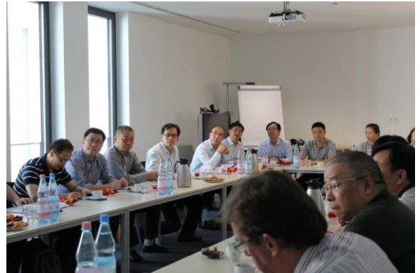
Die Teilnehmer der Delegationsreise informierten sich beim BBB zum Breitbandausbau in Deutschland

25 Teilnehmer einer Delegationsreise aus der chinesischen Provinz Jiangsu nutzten am 12. September die Möglichkeit, sich beim Breitbandbüro des Bundes (BBB) über dessen Organisationsform, den Stand des Breitbandausbaus in Deutschland und die aktuellen Fördermöglichkeiten zu informieren. Im Fokus standen die Digitale Agenda für Deutschland 2014 – 2017 und die Richtlinie „Förderung zur Unterstützung des Breitbandausbaus in der Bundesrepublik Deutschland“. Die Gäste von der Jiangsu Broadcasting Cable Information Network Corp. Ltd. waren besonders an den Rahmenbedingungen der Förderung und Modalitäten zum Betreibermodell interessiert sowie an der Organisation von Gebietskörperschaften und Zweckverbänden.