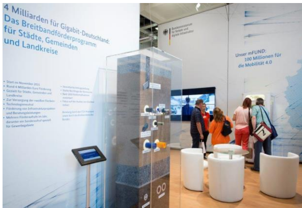
Der gemeinsame Stand vom BMVI und BBB auf der IFA.

Das Breitbandbüro des Bundes (BBB) war gemeinsam mit dem Bundesministerium für Verkehr und Digitale Infrastruktur (BMVI) vom 2. bis 7. September auf der Internationalen Funkausstellung (IFA) vertreten. Auf der global führenden Messe für Consumer und Home Electronics werden jährlich neue Digitaltrends präsentiert, für die leistungsfähige Netze eine elementare Voraussetzung sind.