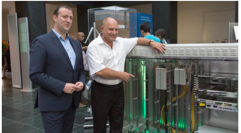
Staatssekretär Bomba besucht den Stand des BBB am Tag der offenen Tür 2016

Die Bundesregierung hat am 27. und 28. August alle Bürgerinnen und Bürger dazu eingeladen, hinter die Kulissen der politischen Institutionen zu schauen. Im Bundesministerium für Verkehr und digitale Infrastruktur (BMVI) waren über 50 Aussteller vertreten, darunter auch das Breitbandbüro des Bundes (BBB). Die Besucher konnten sich am Stand über die Breitbandförderung und die technische Umsetzung des Ausbaus in Deutschland informieren – im persönlichen Gespräch sowie über umfangreiches Infomaterial und anschauliche Exponate, wie einen transparenten Kabelverzweiger.