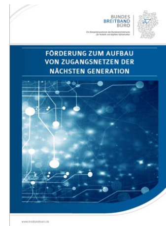
Infobroschüre zur Umsetzung der NGA-Rahmenregelung.

Die Broschüre steht auf der BBB-Website zum Download bereit .